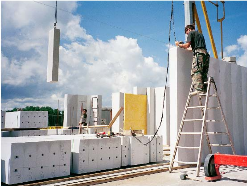
Abb 3: Versetzen geschosshoher Wandtafeln

Auf Grund der Materialstruktur lassen sich alle Porenbetonbauteile leicht bearbeiten. Das heißt, Leitungsschlitze und Steckdosenöffnungen können einfach gefräst oder gebohrt werden. Die planebenen Oberflächen können direkt verflieset oder mit Dünnputz versehen werden. Diese auf Porenbeton abgestimmten Putzsysteme bieten die Möglichkeit einer schnellen Verarbeitung mit geringem Materialbedarf. Bei allen wesentlichen Folgearbeiten ergeben sich damit deutliche Zeiteinsparungen.