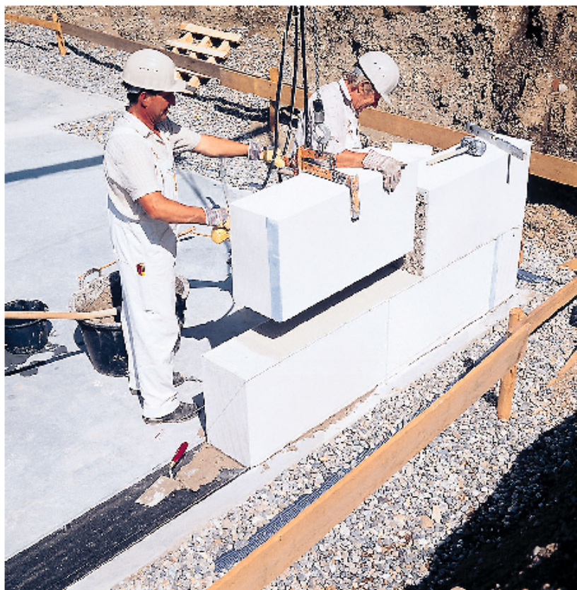
Abb. 1: Versetzen von Porenbeton-Planelementen mit dem Minikran