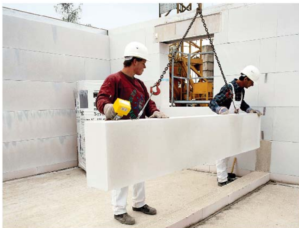
Abb. 2: Versetzen von Porenbeton-Planelementen, lang (bis zu 3 m), mit denen bis zu 1,9 m 2 Mauerwerk mit einem Kranhub erstellt werden können